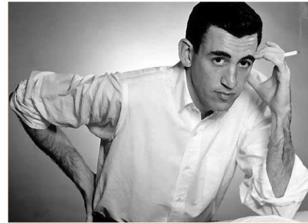
Jerome Salinger, "Der Fänger im Roggen"